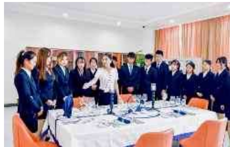
酒店管理与数字化运营实训中心