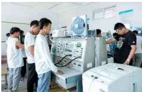
应用电子技术实训中心