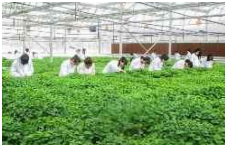
设施农业与装备实训中心