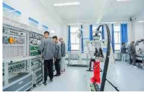
光伏发电原理实训中心