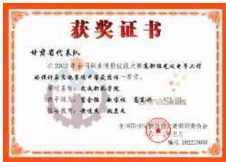
全国职业院校技能大赛团体一等奖

近年来，学校学生在全国职业院校技能大赛、中国国际“互联网+”大学生创新创业大赛、“挑战杯”全国大学生课外学术科技作品竞赛等各级各类赛事中获省级以上奖励 310 余项。截至目前，获得国赛一等奖 1 项、国赛二等奖 1 项、国赛三等奖 4 项。