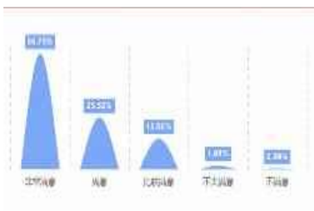
毕业生就业现状满意度

学校完善“党委统筹、部门协同推进、二级学院全面落实”的就业工作机制，持续实施就业优先政策，确保毕业生高质量充分就业。近三年，毕业生毕业去向落实率均保持95%以上，毕业生就业满意度保持在90%以上，用人单位满意度保持在95%以上。80%以上的毕业生在甘肃、新疆、内蒙、宁夏等西北区域就业，服务经济社会发展。