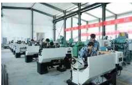
机械制造及自动化实训中心