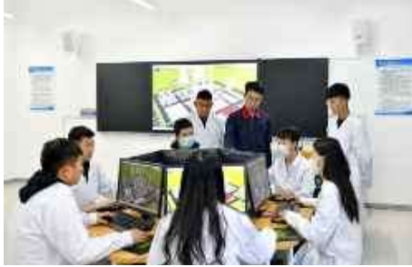
氢能技术应用实训中心