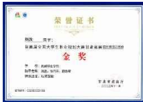
首届全国大学生职业规划大赛省赛金奖