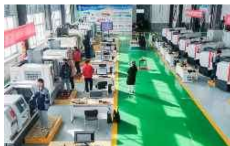
智能制造实训中心