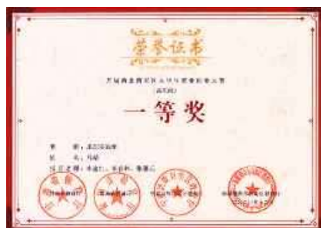
西北四省区大学生就业创业大赛一等奖