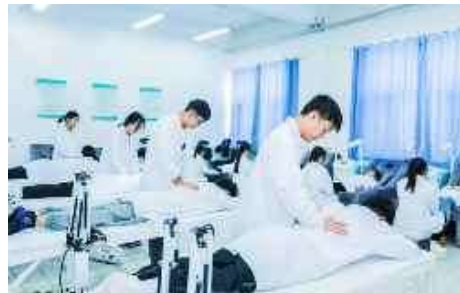
康复治疗技术实训中心