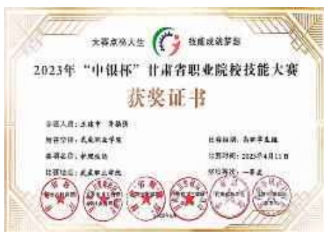
甘肃省职业院校技能大赛一等奖