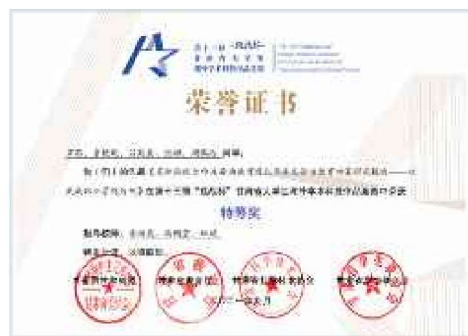
“挑战杯”甘肃省大学生课外学术科技作品竞赛特等奖