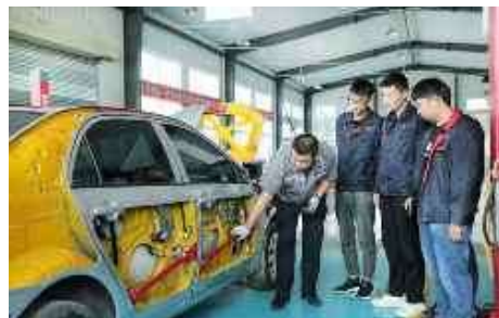
汽车检测与维修实训中心