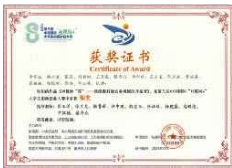
中国国际“互联网+”大学生创新创业大赛国赛铜奖